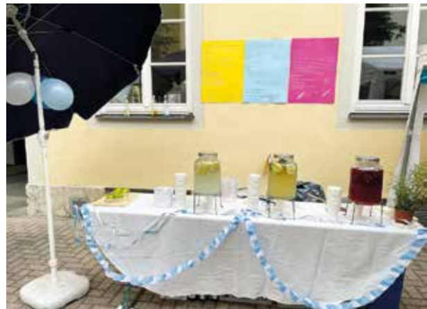
Es darf wieder gefeiert werden!