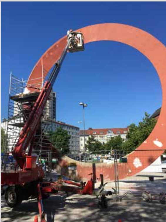
Gut koordinierte Arbeit

Sinn und Zweck koordinierter LSt-Außenprüfungen ist es, ein einheitliches Auftreten der Finanzverwaltung und eine erhöhte Effizienz im Rahmen von LSt-Außenprüfungen sicherzustellen, in denen mehrere Finanzämter für die Prüfung verschiedener lohnsteuerlicher Betriebsstätten eines Arbeitgebers zuständig sind (ähnlich Konzern-Betriebsprüfungen der ertragsteuerlichen Betriebsprüfung).