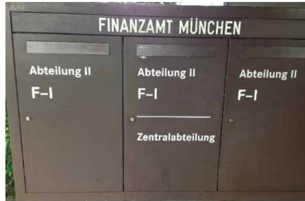
Ebenfalls ein lukrativer Briefkasten - bringt viel Arbeit, aber auch Steuergelder!

„Kavaliersdelikt? Nein, kriminell“ – dieser Kommentar im Wirtschaftsteil der „Süddeutschen Zeitung“ vom 29.12.2021 von Katharina Kutsche sprach mir mal so richtig aus der Seele. Jährlich entgehen unserem Staat bis zu 100 Milliarden aufgrund von Steuerhinterziehung und man fragt sich, wieviel Energie und fehlgeleitete Kreativität etliche unserer Mitbürger/innen dazu bringt, fortgesetzt und nachhaltig die Gemeinschaft zu betrügen. Leider sind unsere Verwaltungen und die Gerichte bisher nur sehr eingeschränkt in der Lage, größere Teile dieser hinterzogenen Abgaben nachträglich durch Prüfungs- und Fahnungsmaßnahmen sicherzustellen, auch das benennt der Kommentar präzise.