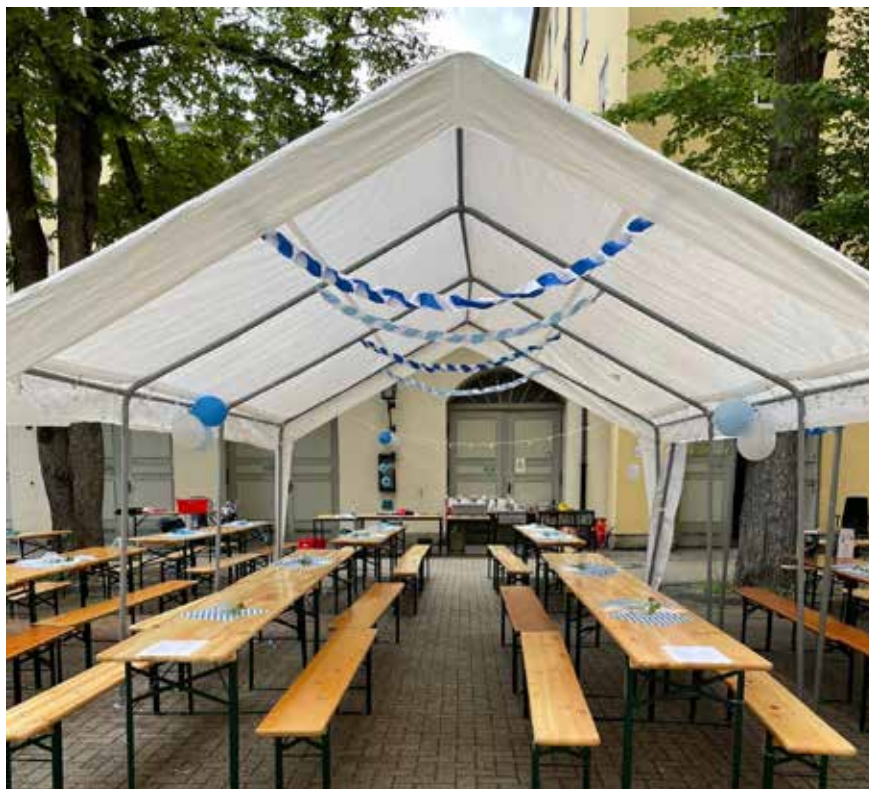
Die Ruhe vor dem (An-)Sturm...