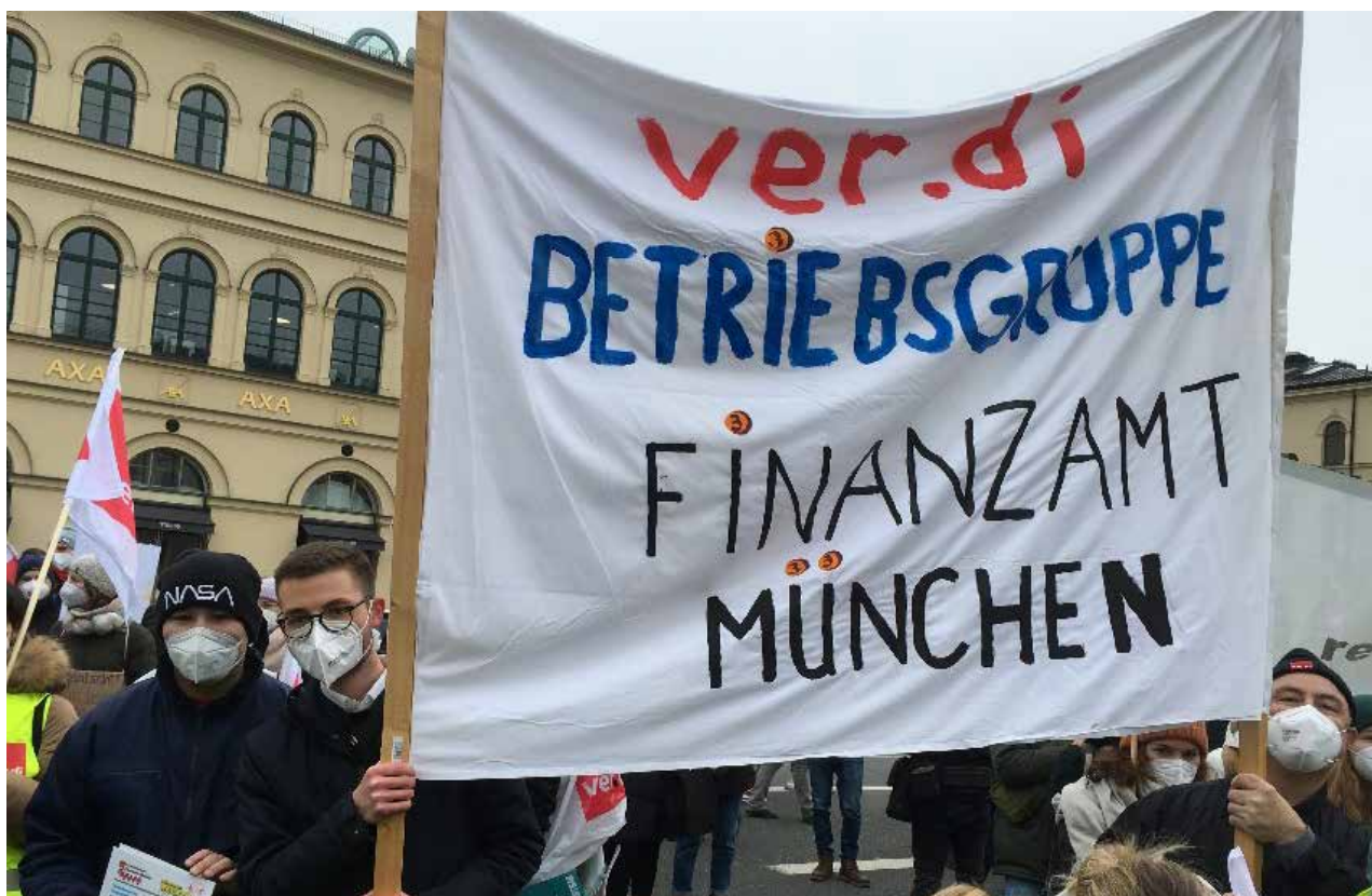
Kundgebung vor dem Finanzministerium November 2021

Das Innen- und Wissenschaftsministerium lehnen den weiteren Einsatz ihrer Beschäftigten im CTT ab. Das Finanzministerium - noch - nicht und es lässt noch dazu immer wieder Anfragen zur Stellenbesetzung anderer Behörden im AIS bekanntgeben. Das Finanzamt fungiert quasi als Selbstbedienungsladen. Dann darf doch gefragt werden: wer füllt eigentlich die „Regale“ wieder auf?